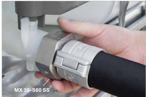
Mutter-Schlauchverschraubung mit Spanifix Einbindung MX 38-S60 SS Female hose coupling with Spanifix clamps MX 38-S60 SS