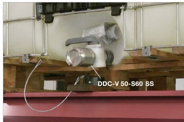
Trockenkupplung DDC-V 50 S60 SS Dry Disconnect Coupling DDC-V 50 S60 SS