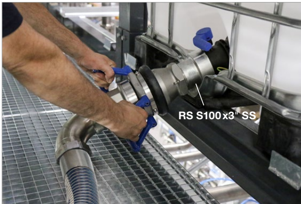
Reduzierstück RS S100x3" SS mit DDC-V 80-3" SS Kupplung Female reducer RS S100x3" SS with DDC-V 80-3" SS coupling