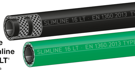
Type Slimline 'SL LT' Slimline Low Temperature