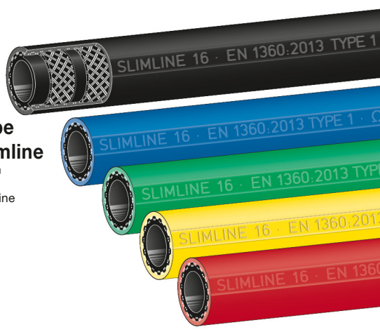
Type Slimline 'SL' Slimline

Innen : NBR schwarz, nahtlos extrudiert, elektrisch ableitfähig, nicht ausfärbend Festigkeitsträger : zwei dehnungsarme Textilgeflechte mit gekreuzten, eingeflochtenen Spezial-Leitfäden Außen : glatt, öl-, UV- und ozonbeständig, hoch abriebfest. Werkstoff siehe Tabelle.