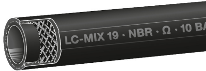
Type LC-Mix Lining NBR electr. dissipative

Economy priced light weight pump hose with textile reinforcement for gasoline, diesel, fuel oil, petroleum. Can not be calibrated.