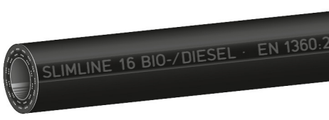
Type Slimline 'SL BIO' Slimline Biodiesel

SLIMLINE quality petrol pump hoses for gasoline and diesel fuels. Also suitable for fuels with ethanol content up to E 85 and Biodiesel up to B30 (BIO Type up to B100). Meets weights and measures regulations, see overleaf. Cold flexible down to -30°C / -22°F (LT-type down to -40°C / -40°F), temp. up to +55°C / +131°F.